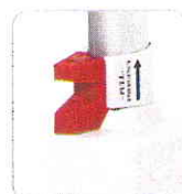
Bajada de emergencia