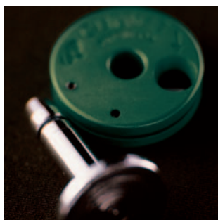
CLIPBELT MAGNÉTICO Una llave magnética facilita el desbloqueo del cierre.