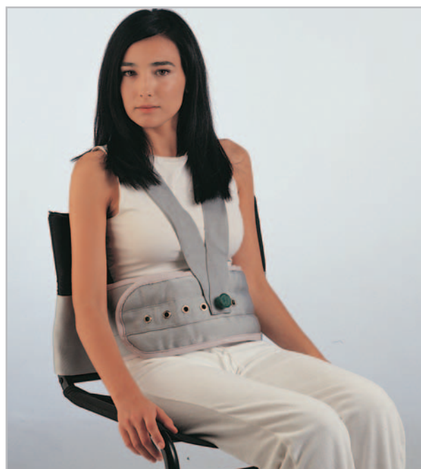
CLIPBELT sujeción a silla o sillón